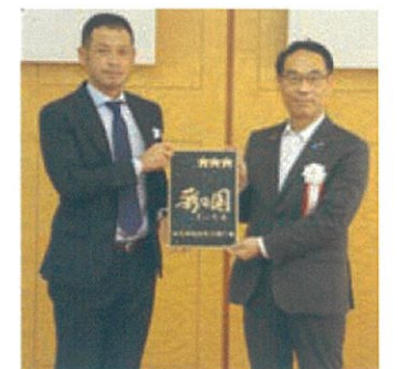
▲大野県知事と「彩の国工場」指定式にて