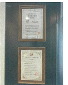
▲健康優良企業および北区SDGs認証の認定書

また、地域貢献としては、北区のしづさわくんFM内で「みんなでサウナ」という番組を配信しています。サウナがテーマになっていますが、ワークライフバランスなど地域コミュニティの在り方など、SDGsを考える上でも重要なテーマについても有識者と話をしています。こちらもよろしければお聞きください。