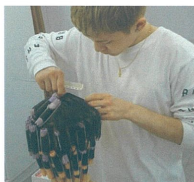
▲従業員の生涯学習は、認証企業としての達成目標の1つです

これにより、従業員一人一人がより頼もしい存在となり、会社として前進し続けられると考えております。