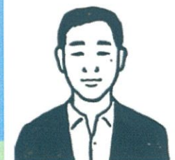
▲しづさわくんFM内の番組「みんなでサウナ」