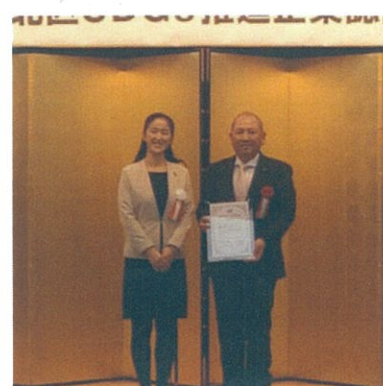
▲北区長とSDGs推進企業認証式にて