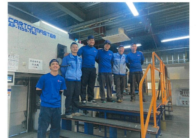
▲末永くお付き合いいただけますよう社員一同頑張っております

今後は、2025年3月までに経済産業省による「責任あるサプライチェーン等における人権尊重のためのガイドライン」を参考に、自社で取り組むべき人権課題を明らかにする予定であり、より良い経営体制を築いていきます。