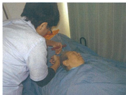
訪問理美容の様子▶